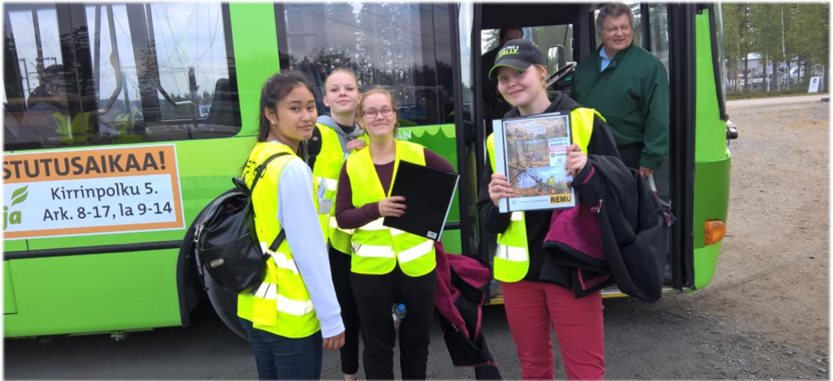
图片：前来参加实践课程的学生

随着中芬两国交流的日益紧密，自 2016 年初在芬兰农林部的牵线下，芬兰机械协会积极寻求中国的合作伙伴，终于在 2017 年 11 月成功访问了国内权威林机协会 -- 中国林业机械协会，希望通过两协会之间密切交往与联系，为两国林木机械行业在技术交流、市场拓展等方面提供更多的增值服务，并且组织互访 FinnMETKO 和合肥国际林机展，增强展会品牌的国际影响力。