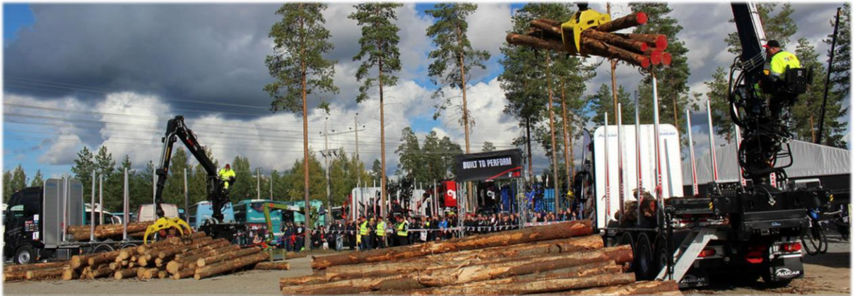
图片：木材装载车技能大赛现场

FinnMETKO 除了作为一个单纯的展会之外，还自 2010 年起与 Gradia Jämsä 技术学院共同举办芬兰全国重型机械操作技能锦标赛，如伐木机操作，挖掘机操作，木材装载车操作等。与此同时，FinnMETKO 也是芬兰林业教育实践课程中重要的一环。每逢 FinnMETKO 举办期间，均有大量的小初高学生，甚至是幼儿园的小朋友在学校的组织下，从芬兰各地搭车前来参加社会实践课程，熟悉林业机械并且了解林业前线工作的相关内容。