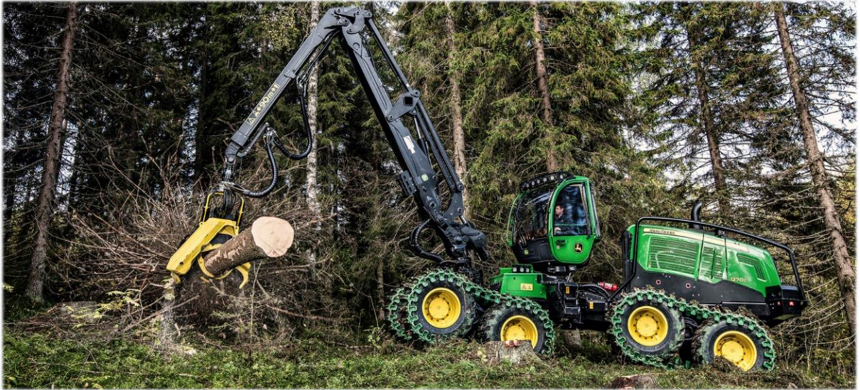
图片：伐木机现场作业展示

FinnMETKO 除了作为一个单纯的展会之外，还自 2010 年起与 Gradia Jämsä 技术学院共同举办芬兰全国重型机械操作技能锦标赛，如伐木机操作，挖掘机操作，木材装载车操作等。与此同时，FinnMETKO 也是芬兰林业教育实践课程中重要的一环。每逢 FinnMETKO 举办期间，均有大量的小初高学生，甚至是幼儿园的小朋友在学校的组织下，从芬兰各地搭车前来参加社会实践课程，熟悉林业机械并且了解林业前线工作的相关内容。